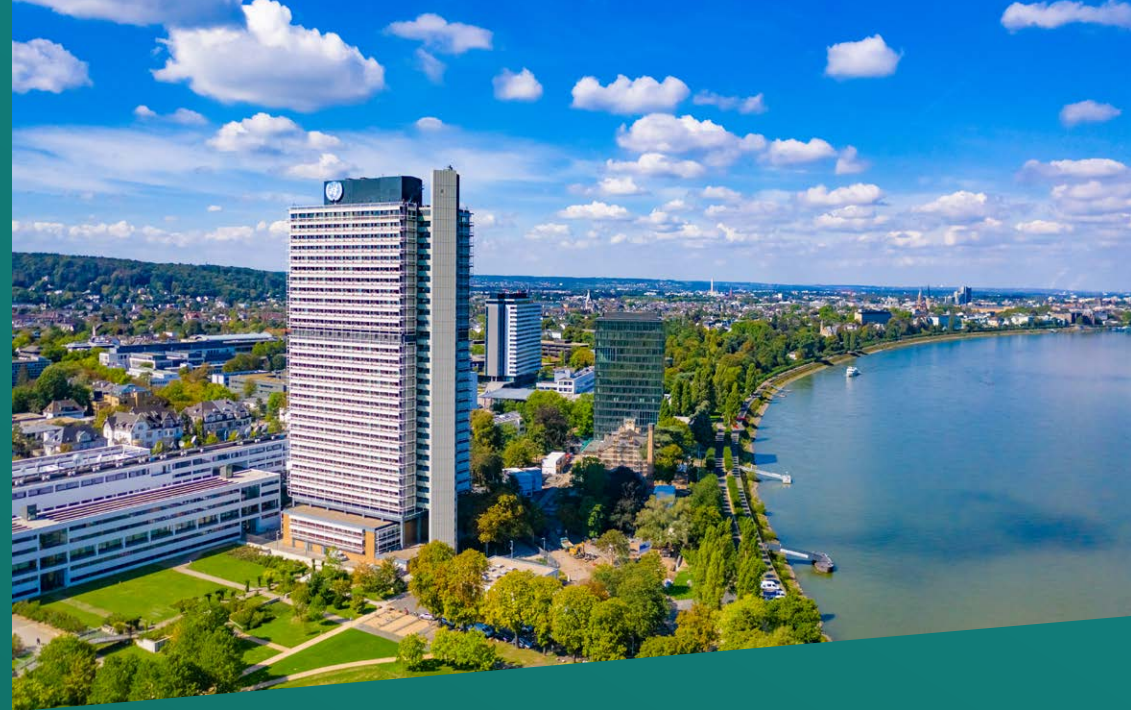
UN Campus Bonn