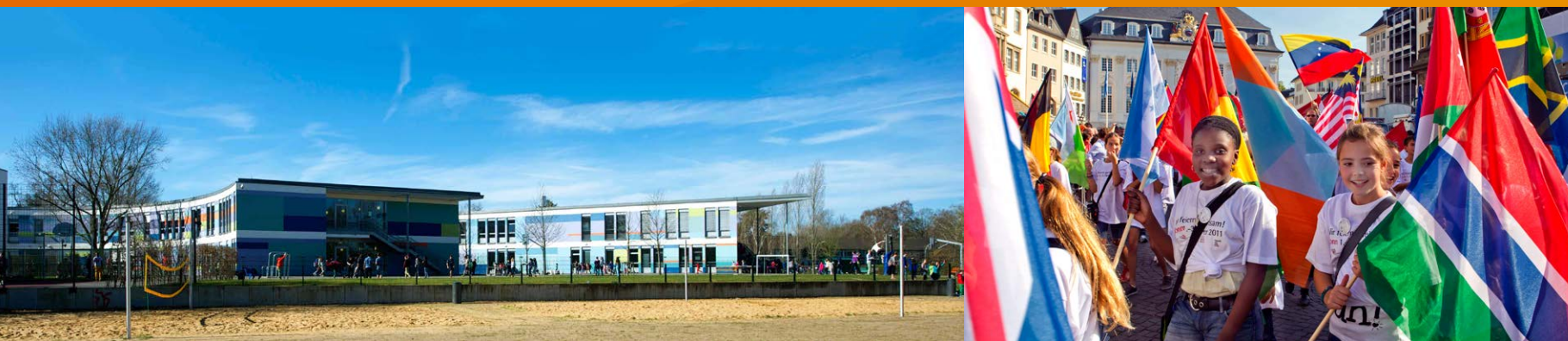
Bonn International School

Die Bonner Schulen arbeiten konstruktiv mit der Universität Bonn zusammen und bieten bei vielen Gelegenheiten – wie der jährlichen Wissenschaftsnacht oder den Kinder-Uni-Veranstaltungen – gute Möglichkeiten, den Nachwuchs früh für die Wissenschaft zu begeistern.