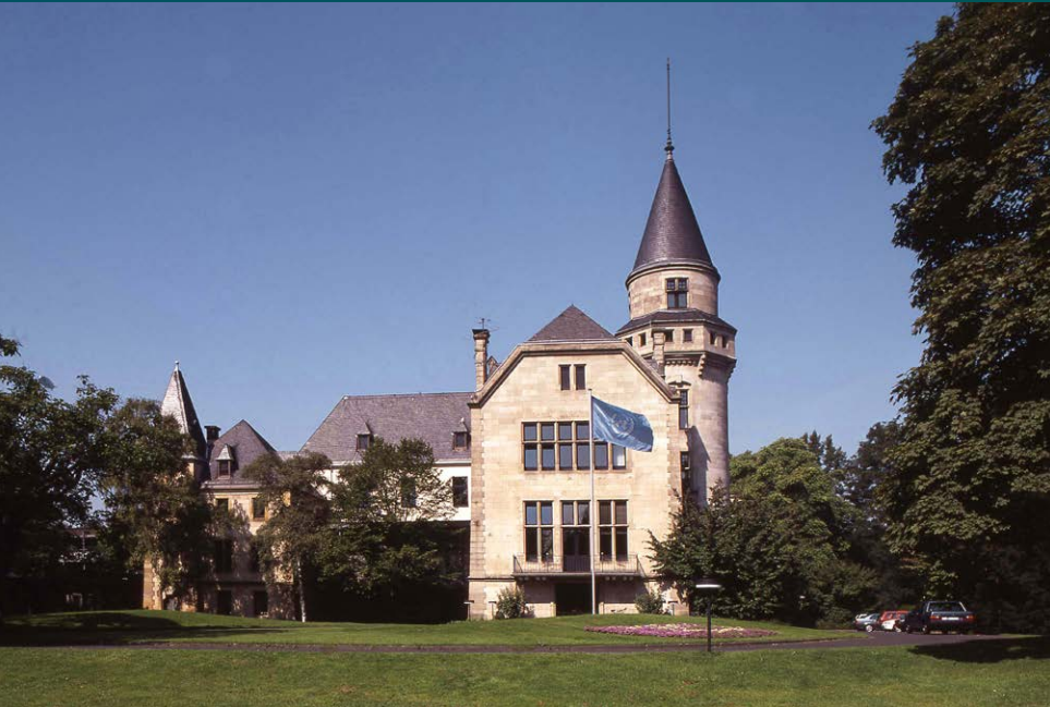
Haus Carstanjen – Der erste Sitz der Vereinten Nationen in Bonn

1996 wurde der UN Campus Bonn mit dem Bezug von Haus Carstanjen als Liegenschaft des VN-Freiwilligenprogramms begründet, 2006 um den Langen Eugen erweitert. Binnen 25 Jahren ist Bonn zu einem Zentrum für globale Zukunftsthemen geworden, zu einem „Powerhouse“ der Nachhaltigkeit, dessen Herz die Vereinten Nationen in der Bundesstadt sind. Der UN Campus im früheren Parlamentsviertel am Rhein ist sichtbares Symbol dieses Wachstums. Hier arbeiten die ansässigen Organisationen der Vereinten Nationen, umgeben von einem Netzwerk aus Bundesministerien und Behörden, internationalen Regierungs- und Nichtregierungsorganisationen, wissenschaftlichen Einrichtungen und Wirtschaftsunternehmen. Unter dem Leitmotiv der Vereinten Nationen in Bonn „Nachhaltigkeit gestalten“ wirken sie alle in einer einzigartigen Kultur von Kreativität und Kooperation zusammen.