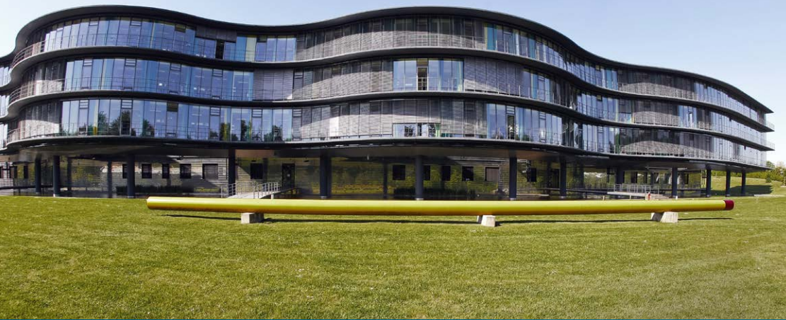
caesar – center of advanced european studies and research in Bonn

Die Region rund um die nordrhein-westfälischen Städte Köln, Bonn und Aachen mit ihren herausragenden Universitäten gilt als die dichteste Forschungs- und Technologielandschaft in Europa. Der Wissenschaftsstandort Bonn, an dem auch das Bundesministerium für Bildung und Forschung (BMBF) seinen ersten Sitz hat, ist international ausgerichtet und trägt dazu bei, nachhaltige Entwicklung weltweit voranzubringen. Unter den ansässigen Wissenschaftseinrichtungen, internationalen Organisationen und der Rheinischen Friedrich-Wilhelms-Universität Bonn – mit ihren heute 35.000 Studierenden aus insgesamt 142 Ländern – ergeben sich vielseitige Möglichkeiten der Zusammenarbeit in zukunftsrelevanten Forschungsfeldern wie menschliche Sicherheit, Klima- und Wasserforschung, biologische Vielfalt oder Ernährungssicherheit. Universität und Stadt Bonn haben 2014 eine Kooperationsvereinbarung unterzeichnet. Sie soll das Alleinstellungsmerkmal des Standortes – starke VN-Präsenz plus ausgeprägtes Nachhaltigkeitscluster – noch wirksamer zur Geltung bringen, indem strategische Partnerschaften zwischen Akteuren aus der Wissenschaft und aus anderen Bereichen etabliert, weiter ausgebaut und in innovativen Veranstaltungsformaten sichtbar gemacht werden.