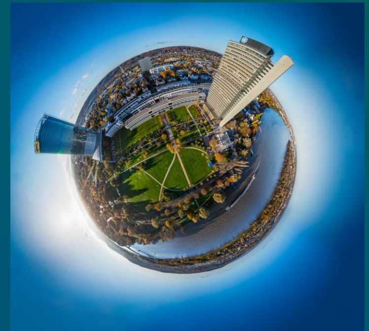
UN Campus Bonn, Deutsche Welle und Post Tower

Die Weltklimakonferenz 2017 in Bonn hat gezeigt, dass der VN-Standort Bonn auch Gastgeber für große, internationale Konferenzen sein kann.