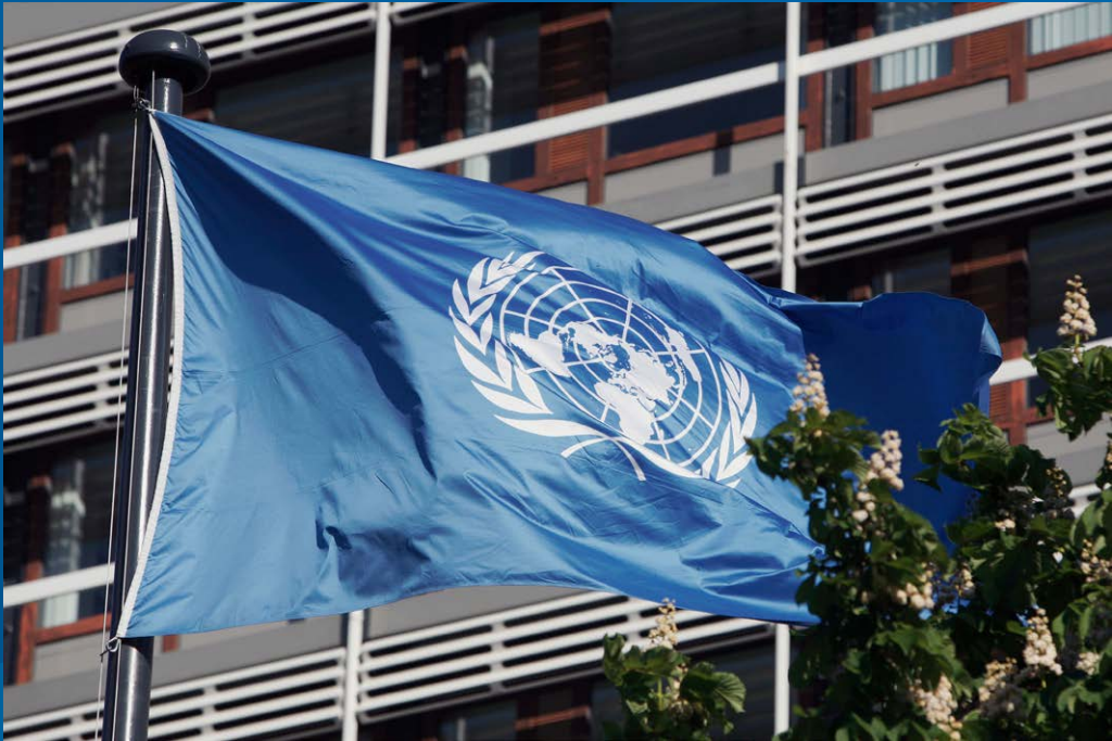
UN-Fahne vor UN-Tower