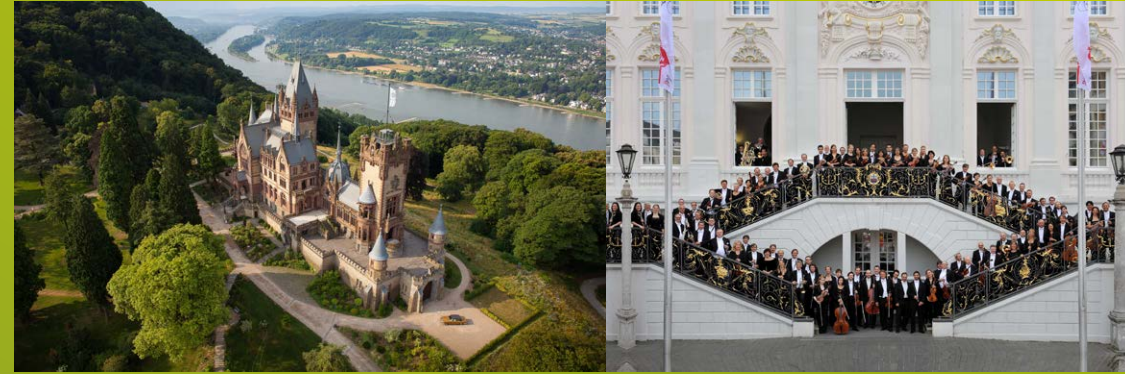
Kirschblüte in der Bonner Altstadt