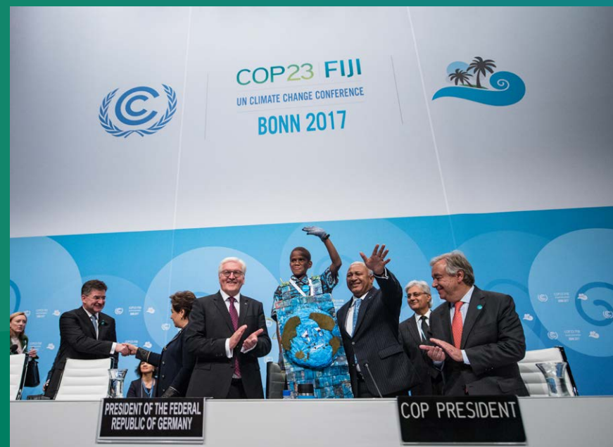
Konferenzstandort für Nachhaltigkeit – das WorldCCBonn

Als bis dato größte zwischenstaatliche Konferenz in Deutschland fand 2017 die Weltklimakonferenz COP23 mit 22.000 Delegierten und Besucherinnen und Besuchern im WorldCCBonn und in eigens für die Konferenz errichteten temporären Bauten statt. Das Global Campaign Center der UN SDG Action Campaign nutzt das unmittelbar neben dem UN Campus gelegene Konferenzareal des WorldCCBonn, um sein jährliches Global Festival of Action auszurichten. Zahlreiche andere Veranstaltungen am Konferenzstandort Bonn sind globalen Fragen gewidmet, so das G20-Außenministertreffen im Februar 2017, das Global Landscapes Forum im Dezember 2017 oder auch regelmäßig stattfindende Konferenzen wie die der Subsidiary Bodies von UNFCCC und das Global Media Forum der Deutschen Welle.