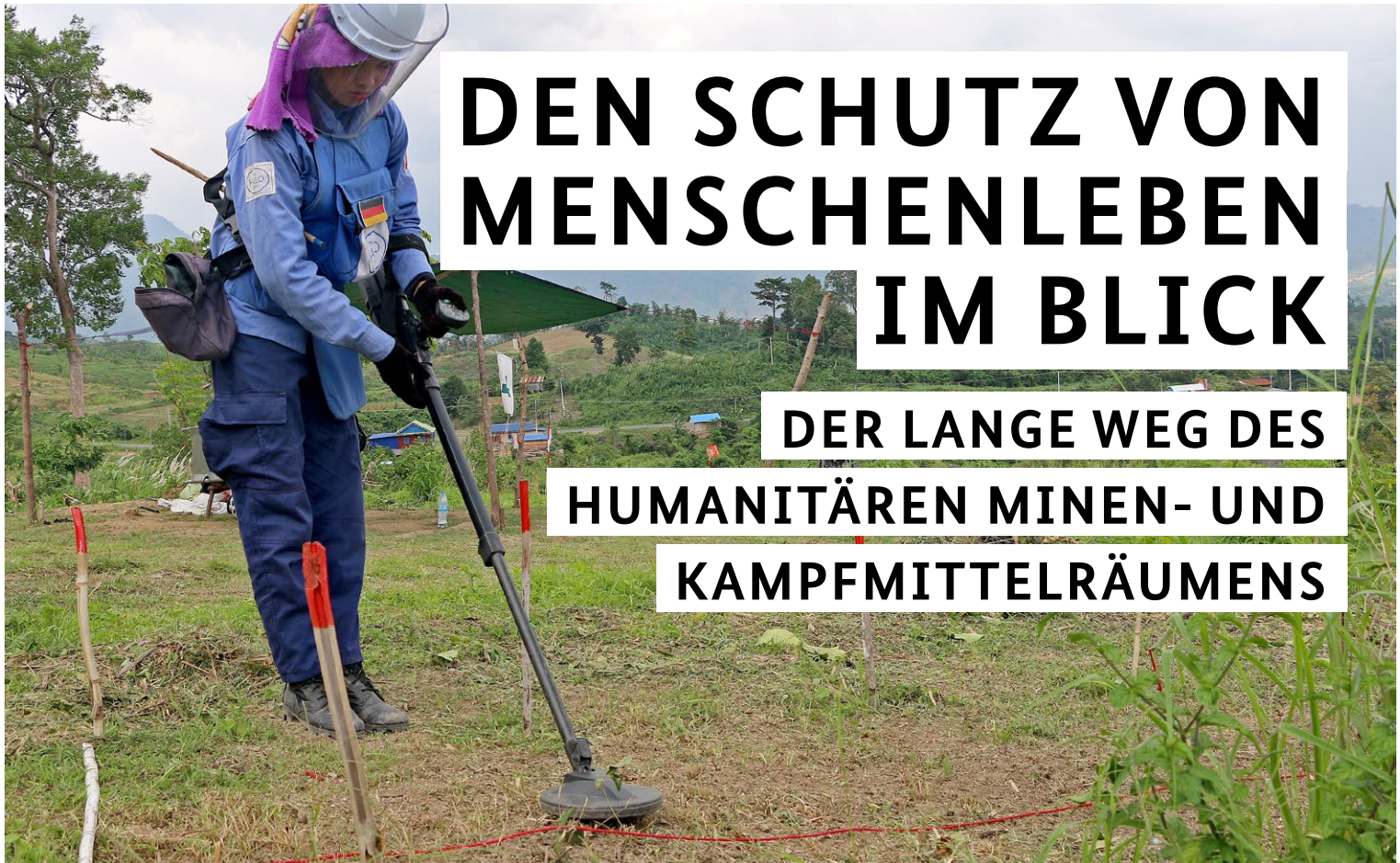
Minenräumerin in Kambodscha.

Der Weg zur Schule ist gefährlich, ebenso wie der Weg zum Brunnen oder zum nächsten Krankenhaus. Ackerflächen können nicht bestellt werden, obwohl es an Nahrung überall mangelt. Kinder riskieren beim Spielen ihr Leben. Dies sind nur einige Beispiele, wie Landminen und explosive Kampfmittelrückstände die Selbstversorgung und damit ein Leben in Würde in vielen Weltregionen verhindern oder beeinträchtigen.