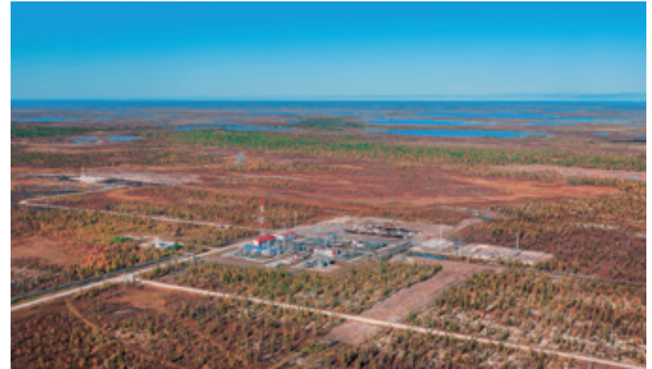
ERDGASGEWINNUNG IN DER TUNDRA, RUSSLAND