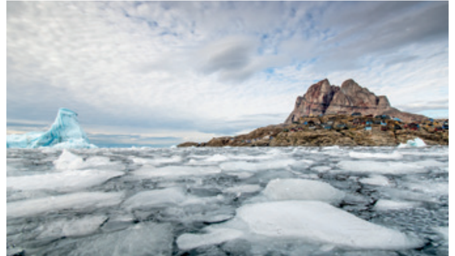
SIEDLUNG AUF EINER LANDZUNGE IN GRÖNLAND