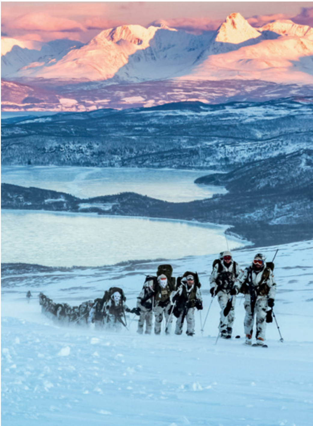
ÜBUNG DER GEBIRGSJÄGERBRIGADE 23 IN BARDUFLOSS-SKJOLD, NORWEGEN