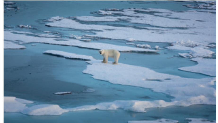
EISBÄR AUF EINER EISSCHOLLE, ARKTISCHER OZEAN