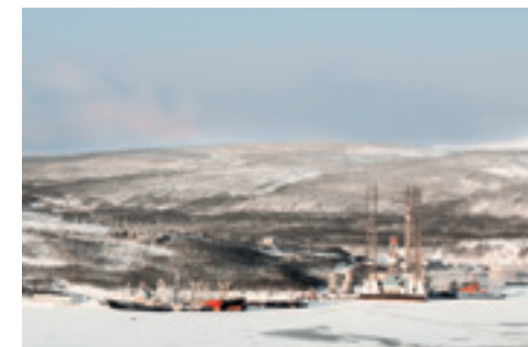
INDUSTRIEANLAGEN AN DER KOLA BAY, RUSSLAND