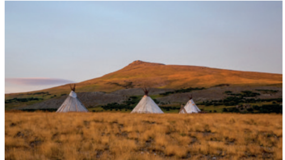
HIRTENZELTE AUF DER JAMAL HALBINSEL, RUSSLAND