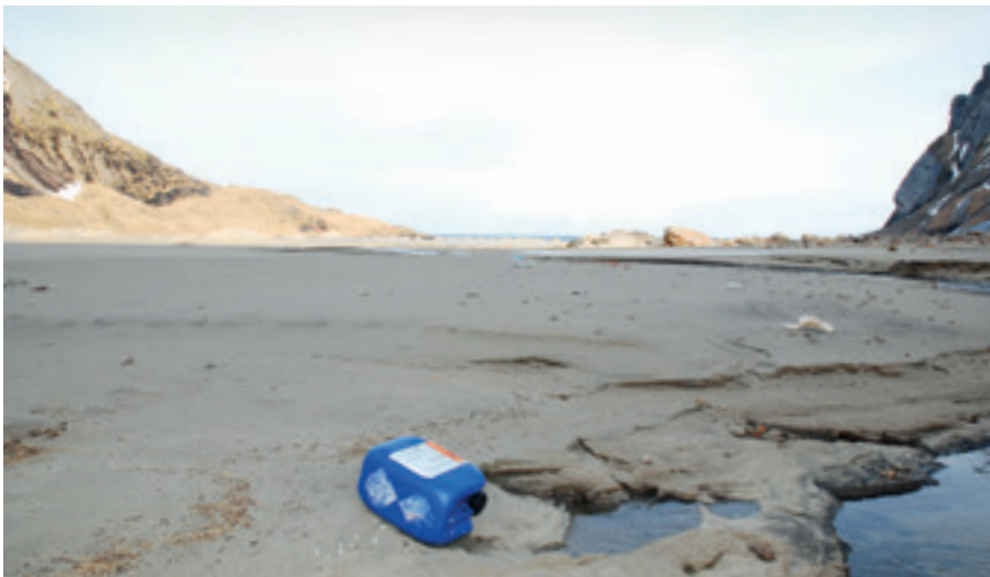
VOM MEER ANGESPÜLTER ABFALL AN EINEM STRANDABSCHNITT AUF DEN LOFOTEN, NORWEGEN