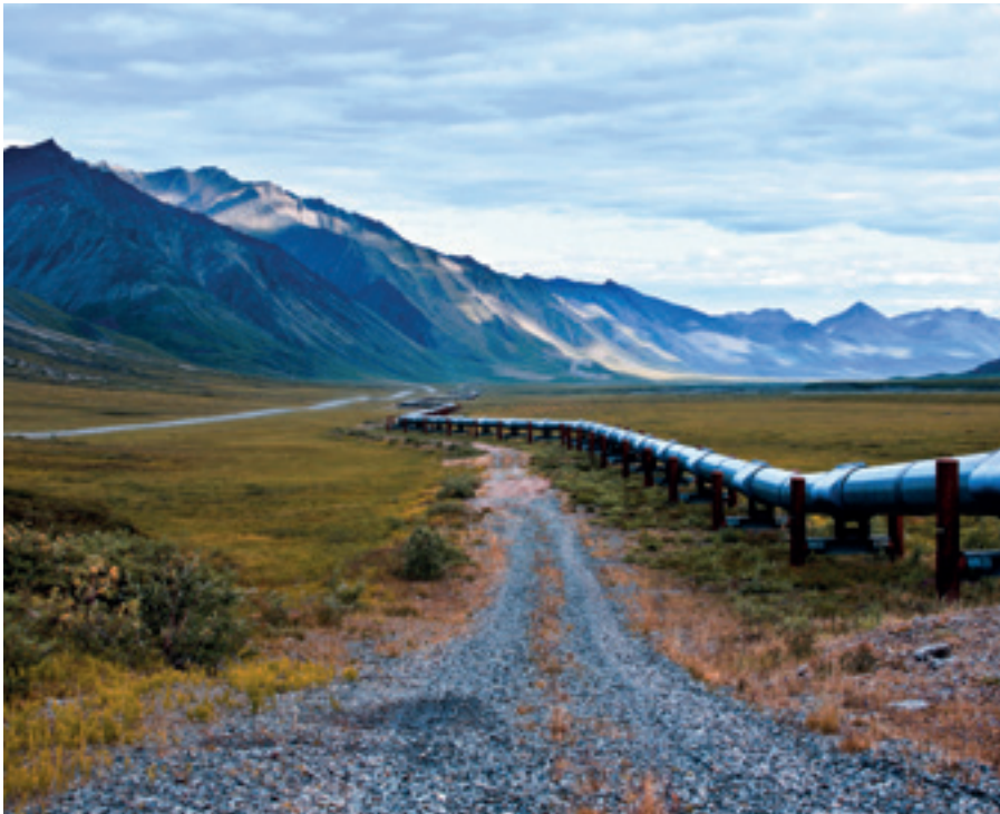
NORTH SLOPE PIPELINE, ALASKA

Mit der Verabschiedung der Agenda 2030 haben die Vereinten Nationen im Jahr 2015 einen neuen Referenzrahmen für die nachhaltige Entwicklung einschließlich der globalen Nachhaltigkeitsziele (Sustainable Development Goals, SDGs) definiert. Arktisrelevante Zielsetzungen zur nachhaltigen Nutzung von Ökosystemen enthalten unter anderem SDG 12 „Nachhaltige Konsum- und Produktionsmuster sicherstellen“, SDG 13 „Maßnahmen zur Bekämpfung des Klimawandels und seiner Auswirkungen“, SDG 14 „Ozeane, Meere und Meeresressourcen schützen und nachhaltig nutzen“ und SDG 15 „Landökosysteme schützen, wiederherstellen und nachhaltig nutzen“.