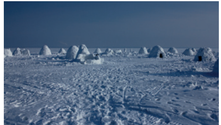
IGLU-SIEDLUNG DER INUIT IM NÖRDLICHEN POLARGEBIET