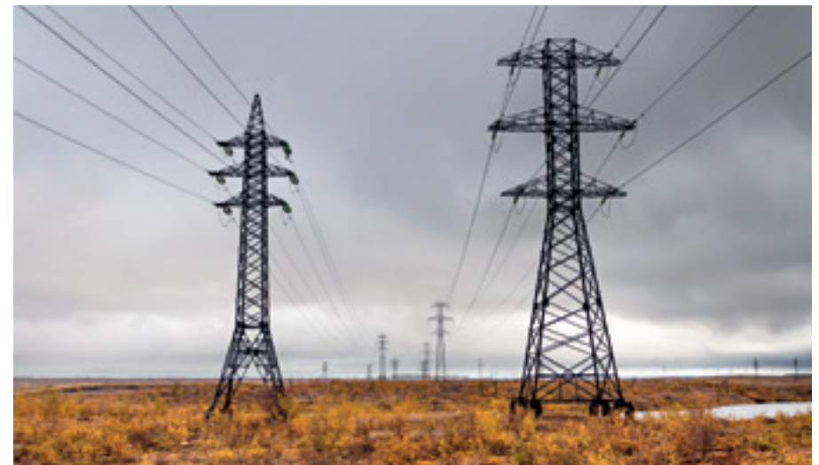
HOCHSPANNUNGSMASTEN AM POLARKREIS