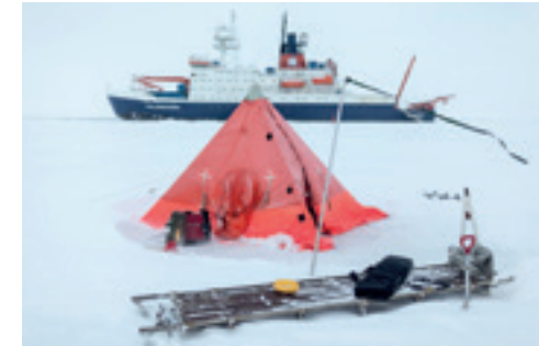
EIN ZELT, DAS WISSENSCHAFTLER FÜR EISUNTERSUCHUNGEN AUFGESTELLT HABEN

Die deutsche Arktisforschung wird primär über die institutionelle Förderung der Helmholtz-Zentren AWI, GEOMAR – Helmholtz-Zentrum für Ozeanforschung Kiel, und das Deutsche Zentrum für Luft- und Raumfahrt (DLR) sowie im Rahmen von gezielten Forschungsprogrammen gefördert. Die Bundesanstalt für Geowissenschaften und Rohstoffe (BGR) forscht zu grundlegenden Fragen der geologischen Entwicklung und Lagerstättenbildung und konzentriert sich auf die Randbereiche des Arktischen Ozeans sowie die Bewertung arktischer Rohstoffpotentiale. Zentral ist die finanzielle Unterstützung von inter- und transdisziplinären Projekten als Grundlage für eine wissenschaftsgestützte Klima-, Umwelt- und Wirtschaftspolitik.