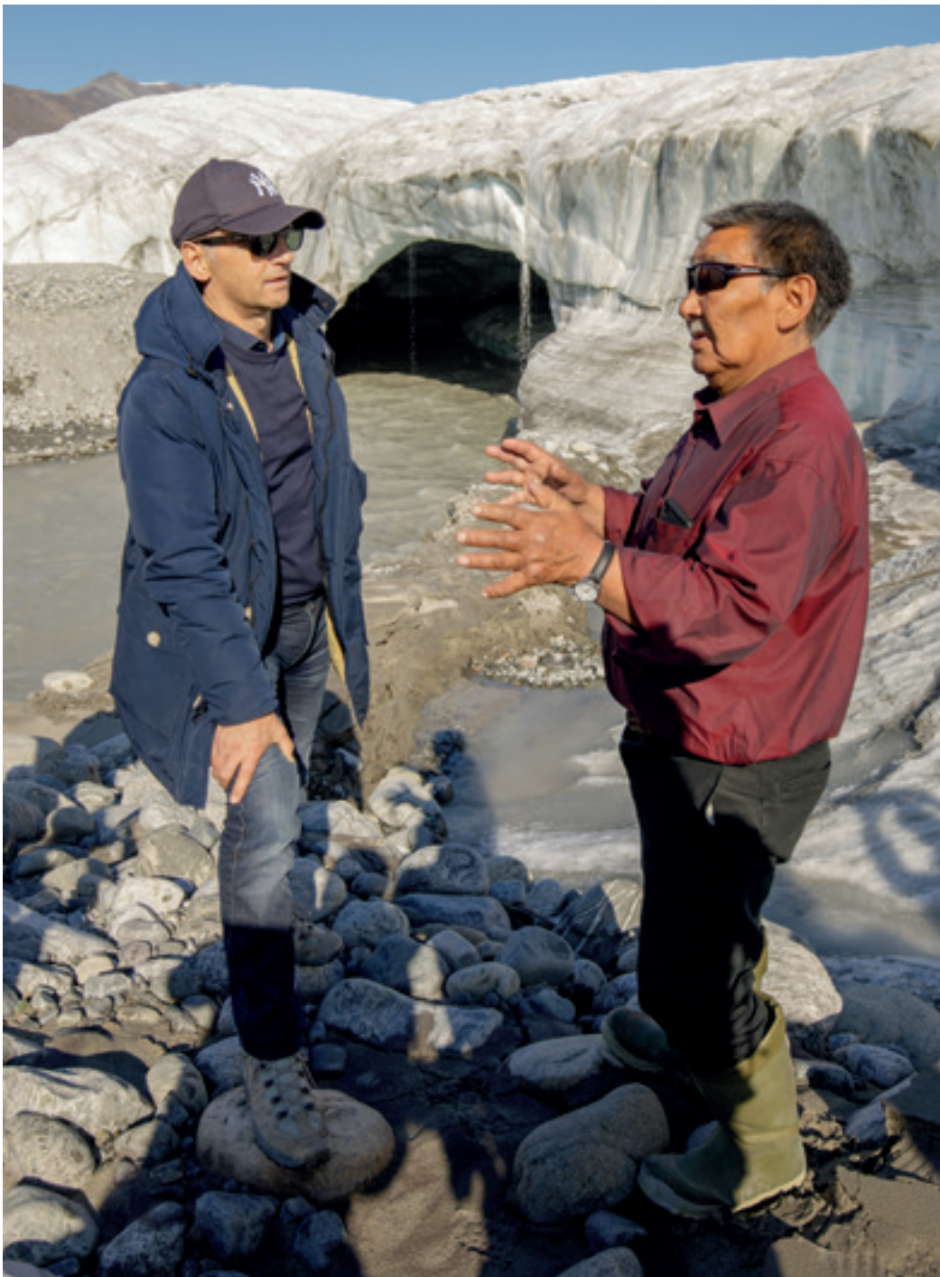
BUNDESAUSSENMINISTER HEIKO MAAS IM GESPRÄCH MIT EINEM RANGER IM SIRMILIK NATIONALPARK IN POND INLET, KANADA