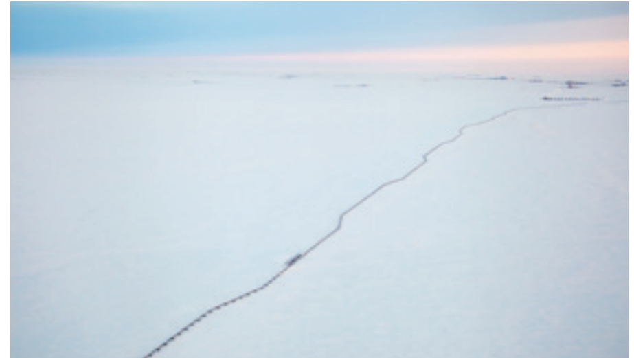
DIE TRANS-ALASKA-PIPELINE BEI PRUDHOE BAY, ALASKA