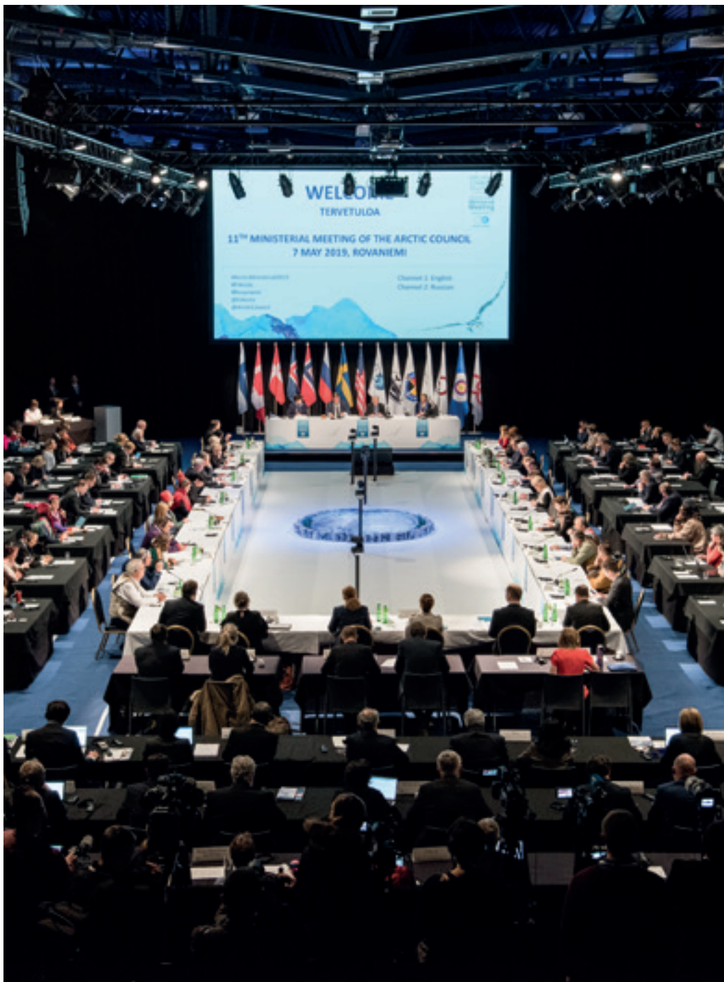
11. AUSSENMINISTERKONFERENZ DES ARKTISCHEN RATS IN ROVANIEMI, FINNLAND