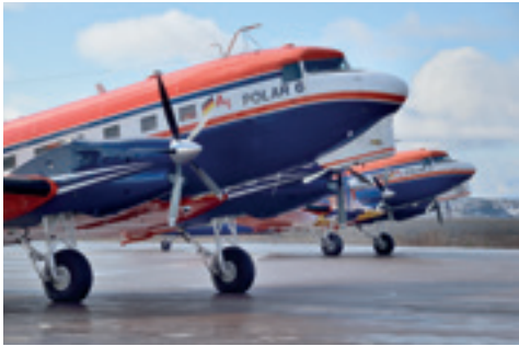
DIE DEUTSCHEN FORSCHUNGSFLUGZEUGE POLAR 5 UND POLAR 6

Die vordringlichsten Fragen der deutschen Arktisforschung sind im Strategiepapier „Schnelle Veränderungen in der Arktis: Polarforschung in globaler Verantwortung“ formuliert. Die dort festgelegten Ziele konzentrieren sich insbesondere darauf, Ökosystemfunktionen zu verstehen, Änderungen im globalen