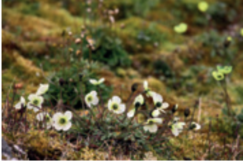
ARKTISCHE MOHNBLUMEN

Aufgrund der extremen Lebensbedingungen, die einen hohen Spezialisierungsdruck für die Tier- und Pflanzenwelt zur Folge haben, gilt die Arktis als besonders empfindliches Ökosystem. Abnehmendes Meereis, fortschreitende Ozeanversauerung und zunehmender wirtschaftlicher Nutzungsdruck bedrohen Arten, die auf die Arktis als Lebensraum angewiesen sind.