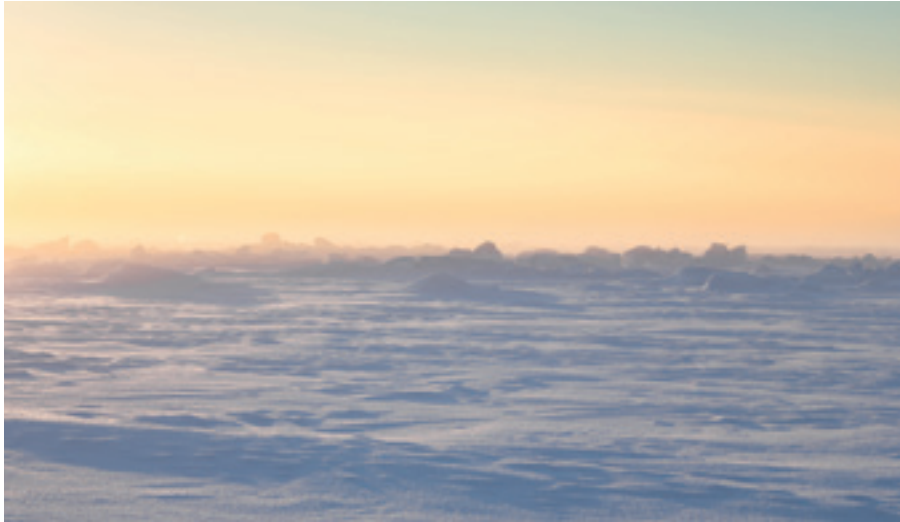
SCHNEEBEDECKTES ARKTISCHES PACKEIS