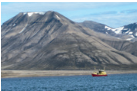
FISCHFANG BEI SPITZBERGEN, NORWEGEN

Angesichts zunehmenden Interesses an der Arktis und entsprechenden Aktivitäten kommt den Regelungen des SRÜ eine entscheidende Bedeutung zu. Es regelt unter anderem die Festlegung und Abgrenzung von Festlandsockeln, Schifffahrtsrechte, Transitdurchfahrt und friedliche Durchfahrt, Freiheit der wissenschaftlichen Meeresforschung, Nutzung und Erhaltung der lebenden Ressourcen sowie Verhütung, Verringerung und Überwachung der Verschmutzung der Meeresumwelt einschließlich eisbedeckter Gebiete. Für den Schutz des Arktischen Ozeans von besonderer Relevanz ist das Bestreben, ein SRÜ-Durchführungsabkommen zum Schutz und zur nachhaltigen Nutzung der Biologischen Vielfalt jenseits nationaler Hoheitsgebiete abzuschließen.