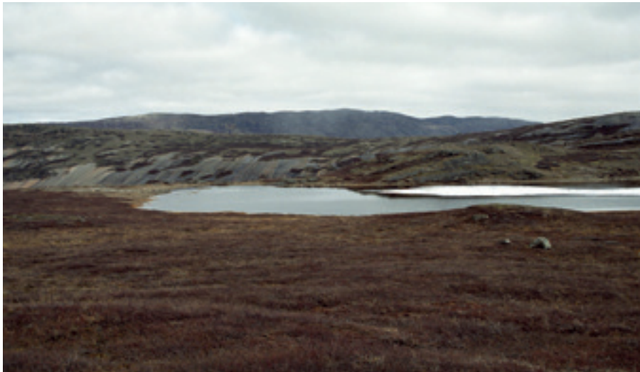
SCHNEESCHMELZE BEI KANGERLUSSUAQ, GRÖNLAND