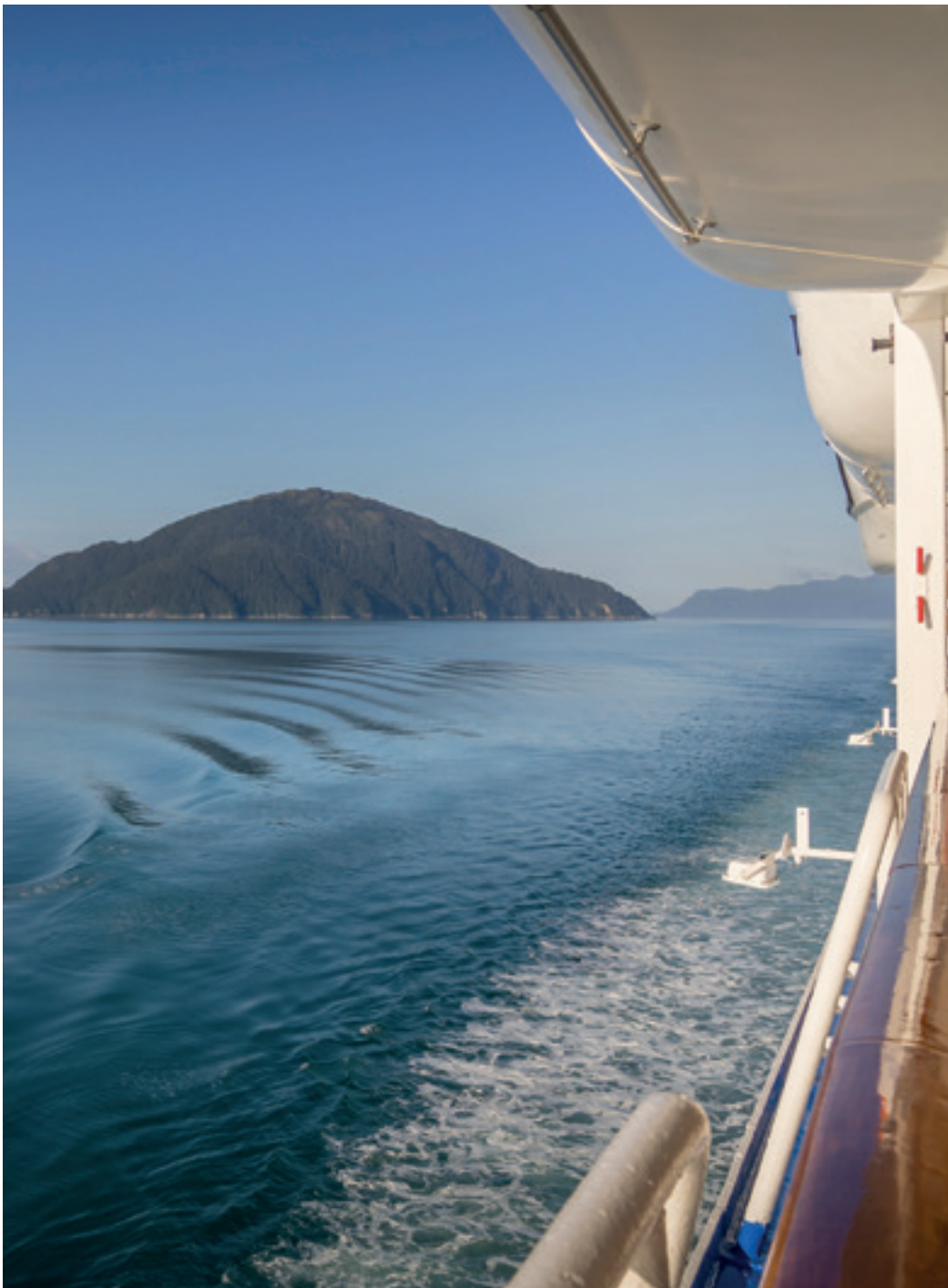
KREUZFAHRT AN DER KÜSTE ALASKAS