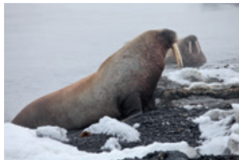
WALRÖSSER AM STRAND

Das Umweltbundesamt (UBA) und das Bundesamt für Naturschutz (BfN) verfügen über eine umfassende und vielfältige Umweltschutzexpertise, die sie auch in die Arbeits- und Expertengruppen des Arktischen Rats einbringen.