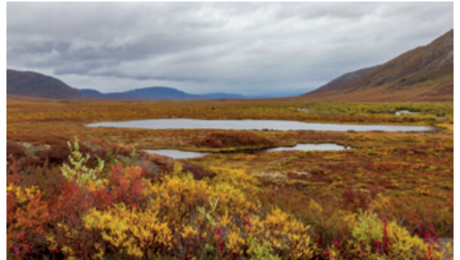
PFLANZEN IN DER TUNDRA, YUCON, KANADA