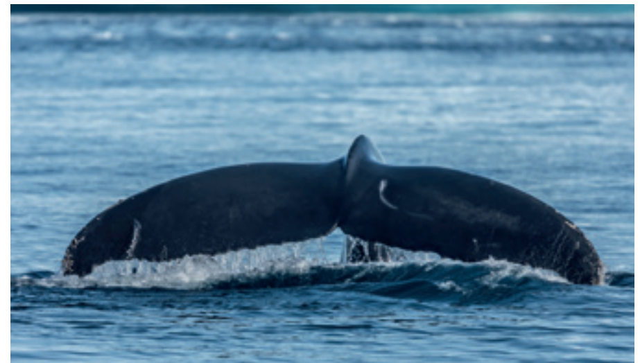
WAL IM ARKTISCHEN OZEAN, GRÖNLAND