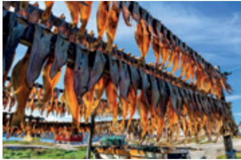
GETROCKNETE FISCH IN DER RODEBAY SIEDLUNG, GRÖNLAND

gemäß der UN-Deklaration zu den Rechten indigener Völker (UNDRIP) für die indigene Bevölkerung der Arktis ein und strebt die Ratifizierung der ILO-Konvention 169 zum Schutz der indigenen Völker an.