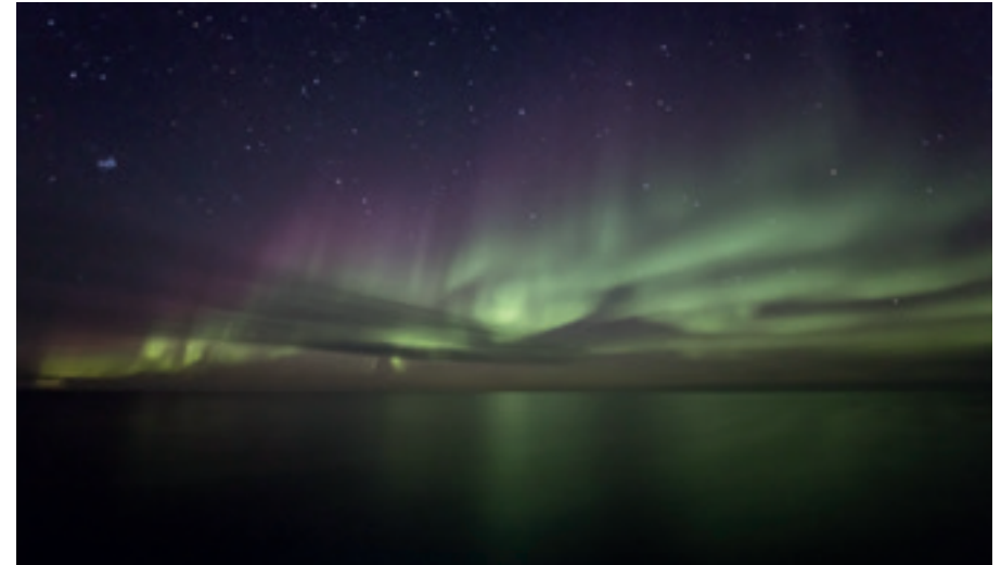
POLARLICHTER ÜBER DEM ZENTRALEN ARKTISCHEN OZEAN

Mit dem Beschluss der Arktisleitlinien unterstreicht die Bundesregierung die zentrale Bedeutung einer ganzheitlichen deutschen Arktispolitik und hebt die gemeinsame Verantwortung aller Akteure für diese sensible Region hervor.