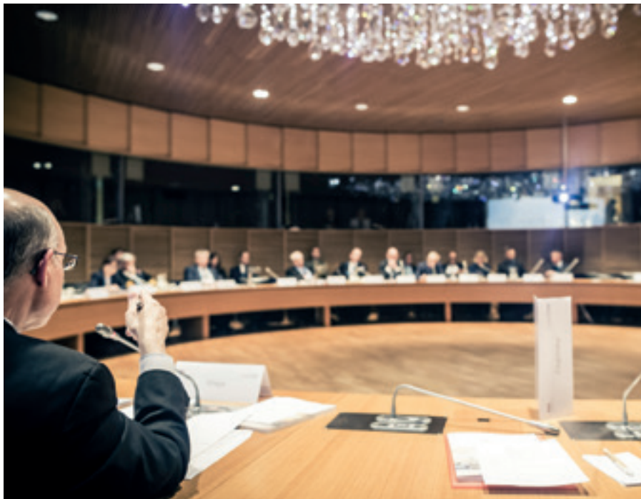
ROUNDTABLE ON ARCTIC SECURITY IN HELSINKI, FINNLAND