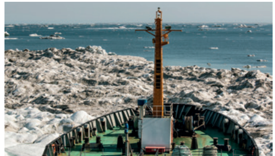
TANKER IM ARKTISCHEN PAKKEIS