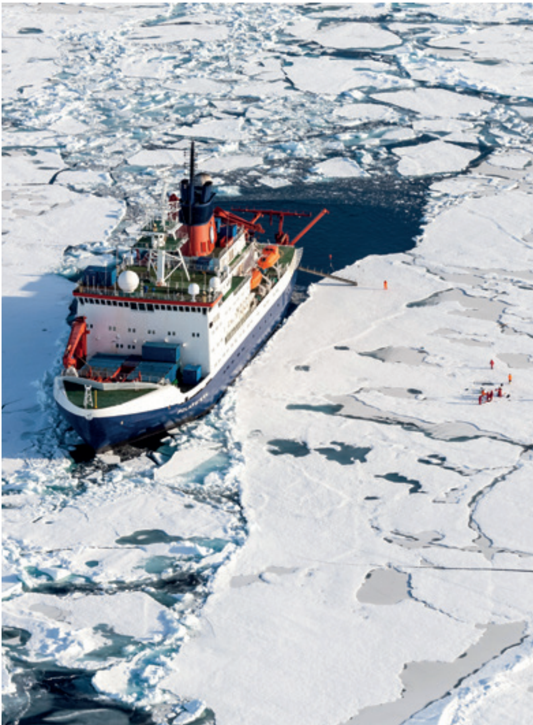
DAS FORSCHUNGSSCHIFF POLARSTERN DES ALFRED-WEGENER-INSTITUTS FÜR POLAR- UND MEERESFORSCHUNG