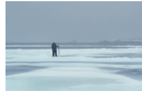
EIN JÄGER DER INUIT IN NUNAVIK, QUEBEC, KANADA

Die Erwärmung der Arktisregion, die zunehmende ökonomische Erschließung und Förderung arktischer Bodenschätze und die intensivierte Schifffahrt gefährden die natürlichen Lebensgrundlagen und kulturellen Traditionen der indigenen Bevölkerung durch Umweltschäden, Veränderung von Ökosystemen und erhöhte Gesundheitsrisiken. Eine der größten Herausforderungen besteht darin, lokale Erfordernisse, nationale Politik und globale Bedingungen miteinander zu vereinbaren.