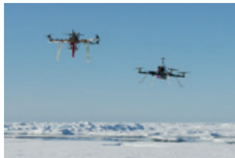
MULTIKOPTER-EINSATZ IN DER ARKTIS

Grundlage für die Strategie des deutschen Arktisforschungsprogramms ist das Forschungsprogramm der Bundesregierung „Mare:N – Küsten-, Meeres- und Polarforschung für Nachhaltigkeit“. Weiterhin bekennt sich die Bundesregierung zu den strategischen Zielen, die von den Forschungsministern der Arktisstaaten und in der Arktisforschung engagierten Staaten in der Gemeinsamen Erklärung anlässlich der Zweiten Arktiswissenschaftsministerkonferenz unterzeichnet wurden. Die Erklärung hat eine verstärkte und besser koordinierte internationale Zusammenarbeit zum Verständnis der schnellen Veränderungen in der Arktis zum Ziel. In den drei Teilbereichen (1) Observationen und gemeinsame Datennutzung, (2) regionale und globale Veränderungen und (3) Herausforderungen der Bewohner der Arktis aufgrund des globalen Wandels soll die internationale Kooperation in der Arktisforschung verbessert und ausgebaut werden.