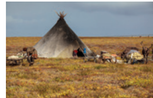
NOMADEN AUF DER JAMAL HALBINSEL, RUSSLAND

Die Zusammenarbeit von Anrainerstaaten, Experten und indigenen Bevölkerungsgruppen im AR ermöglicht den Austausch und Ausgleich von internationalen und regionalen Interessen durch multilaterale Arbeit. Die praktische Arbeit des AR wird in sechs Arbeitsgruppen koordiniert, so zu Forschungsprojekten und Entwicklungsvorhaben zum Erhalt der Artenvielfalt oder im Verkehrsbereich.