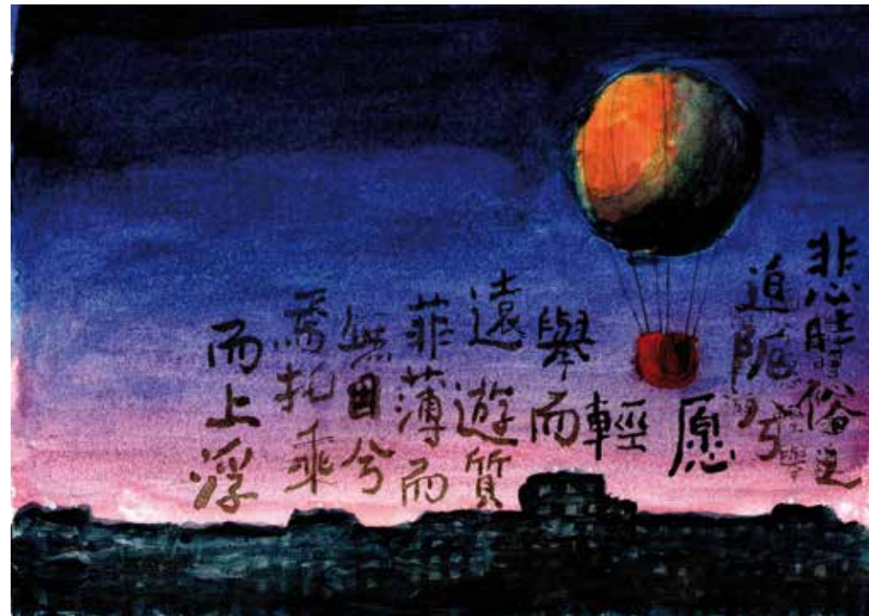
Yüen You, 2016, mixed media on paper, 15 x 21 cm