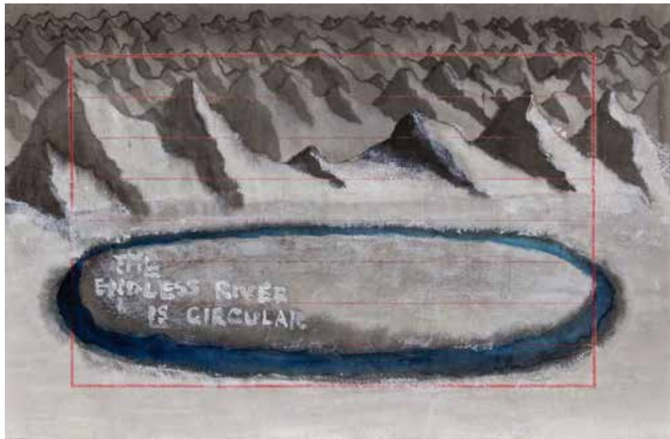
Untitled, 2018, mixed media on paper, 18 x 28 cm