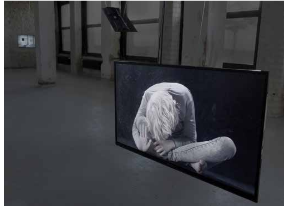
SCREEN , 2017, one channel video installation HD-loop, 56 min, color, sound, 55 x 92 cm life-size on a free hanging 40 inch monitor

With time, her posture becomes less stable; her body adjusts, loses its balance, has to be repositioned. Slowly, she starts to slide from the glass plate, losing her foothold—only to regain it again in a second attempt. At times, she faces forward self-confidently, in others, she looks around in search for support. Then she looks directly at the beholder. What follows is a moment of close intimacy that conveys insecurity and fragility, but also willpower and determination. Although the performer keeps sliding down, she always climbs back up again, lastly surmounting the glass pane in the video loop. As a modern monument of victory, the screen shows an immaculate body whose vulnerability and fallibility are nevertheless always present. The video sculpture appears as a metaphor for an overcoming of the glass ceiling, a determined ascent that does not mean rigidification but admits all uncertainties and failures. Together with the performer, beholders experience how doubtfulness is turned into confidence, in order to try again after every setback. The performer offers an alternative medial role model, to which viewers literally “look up.” The question remains whether it can also be transferred to reality as easily as the dissolution of the medial barrier suggests.